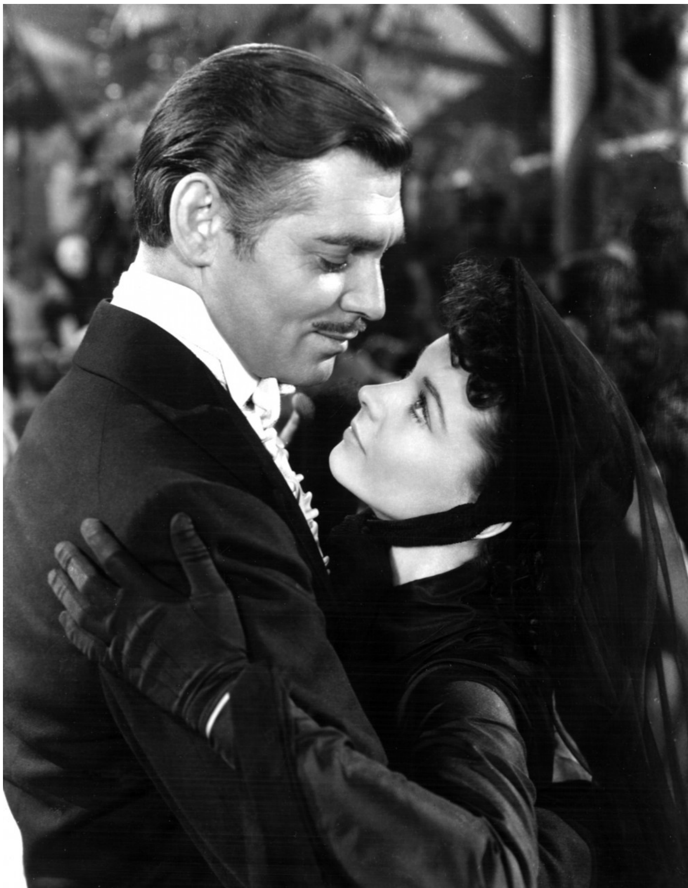
KLASSIKER Filmen Gone with the wind er fra 1939 med Clark Gable (Rhett Butler) og Vivien Leigh (Scarlett O'Hara) i hovedrollene. Regi: Victor Fleming.