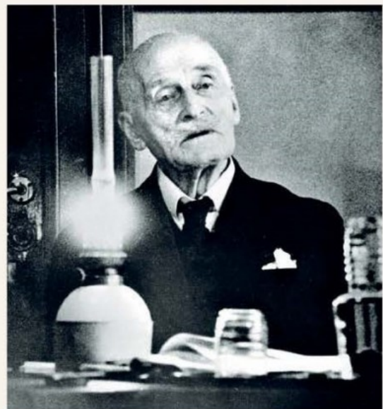
DØMMES Knut Hamsun i Grimstad herredsrett i 1947.

– Det minner om noe den norsk-amerikanske forfatteren Siri Hustvedt skriver i sin siste essaysamling A woman looking at men looking at women , at det å lese skjønnlitteratur er å foreta en ekskursjon inn et annet menneskets sinn, som er ulikt vårt eget.