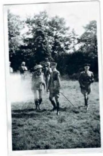
KONGELIGMØTE I dagboken skriver Arthur Hauge om møtene med Kong Haakon (i midten) og kronprins Olav (til høyre), som regelmessig inspiserte og motiverte de norske styrkene i Skottland.