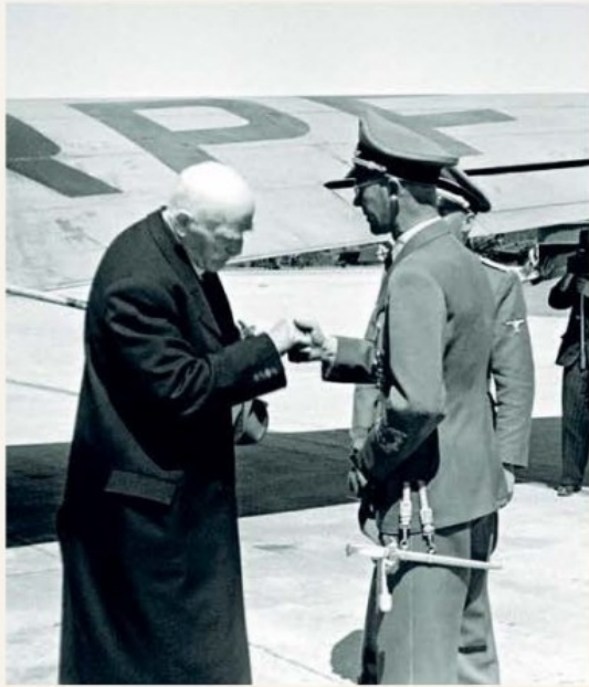
ANSTRENGT MØTE Knut Hamsun møtte Josef Terboven på Fornebu da han kom fra Tyskland i 1943. Hamsun var imidlertid sterkt kritisk til Terbovens regime, og da Hamsun møtte Hitler benyttet han anledningen til å kritisere den øverste lederen for okkupasjonen av Norge.

komplementært, tenke på ulike måter samtidig. For blikket vi lærer å oppøve ved å lese litteratur, er nyttig i forståelsen av andre mennesker, som klinisk psykolog.