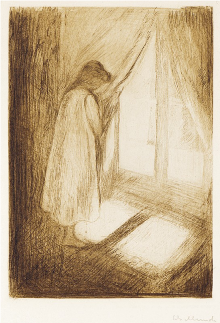
Bilde Edvard Munch (1894), Piken ved vinduet

Ibsen har på en forbløffende og imponerende måte skapt Hedvig-skikkelsen som en ungdom i en familie med nettopp de karakteristika nyere psykologisk teori og forskning har vist at har større risiko for selvmord enn andre ungdommer.