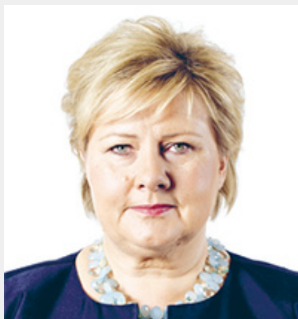
Statsminister Erna Solberg.

- Det er viktig at vi setter i gang tiltak som er kunnskapsbaserte, men vi må også prøve ut nye tiltak. Det er ikke bra å avvise alle tiltak som det ikke er så mye kunnskap om. Vi må finne tiltak, og sørge for at vi følger opp kunnskapen gjennom å prøve dem ut, svarte Solberg, og fortsatte: Det kan hende at noen har nye ideer i samfunnet vårt, og andre måter å gjøre ting på, uten at det er gjennom-evaluert på forhånd.