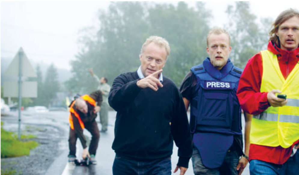
SUNDEVOLDEN 22. JULI: Trafikk-kaos gjorde at Raymond Johansen fikk skyss med ambulanse det siste stykket. I følge med to journalister når han ved 19-tida Sollihøgda der veien er sperret.

Partisekretæren forteller om trafikk-kaoset som gjorde at han fikk skyss med en ambulanse det siste stykket. Vel en time etter at gjerningsmannen var tatt, nådde han frem til Sundvollen. Situasjonen han nådde der er det verste han har opplevd. Det kommer busser med klissvåte og frosne ungdommer. De har tepper rundt seg, og er åpenbart vettskremte.