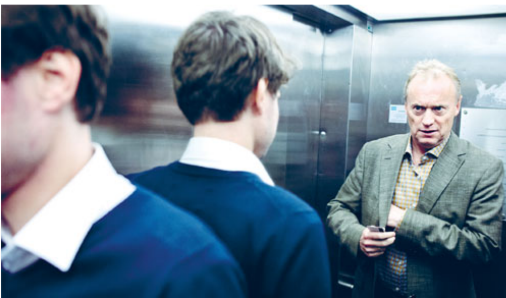
TETT FORHOLD: – Vi som jobbet sammen da, har vist hverandre

– Det er viktig å huske at vi er et politisk parti. Vi er ikke trent og har ikke erfaring med å håndtere denne type kriser. Det er helt sikkert ting vi burde gjort annerledes.