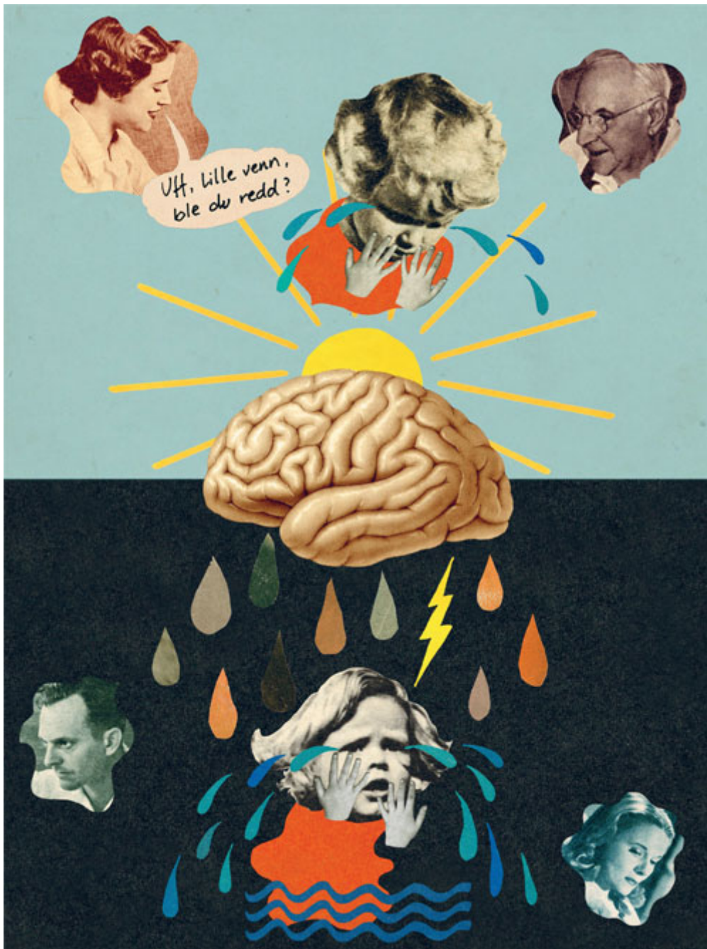
ILLUSTRASJON: JILL MORSUND

I de senere årene har utviklings- og traume psykologien beveget seg fra å være ganske adskilte til å bli høyst integrerte disipliner. En årsak til integreringen er den voksende dokumentasjonen av de store konsekvensene traumer ofte får når de skjer i omsorgsrelasjoner og i utviklings sensitive perioder av livet (Felitti et al., 1998; Briere, Kaltman & Green, 2008). En annen grunn er kunnskap fra nevrobiologisk forskning som viser hvordan omsorgserfaringer påvirker hjernens evne til å håndtere trusler og stressbelastninger senere (Ford, 2009; Cloitre et al., 2009). Man kan si at utviklings- og traume psykologien har «smeltet sammen» på et felles nevrobiologisk kunnskapsgrunnlag. Et produkt av sammensmeltingen er at begreper som regulering og toleransevinduet , som tidligere mest tilhørte utviklings psykologien, nå har blitt nøkkelbegreper også i traume psykologien. I denne artikkelen ønsker vi å vise hvordan reguleringsbegrepet gir mulighet en for ny definisjon og teoretisk forståelse av