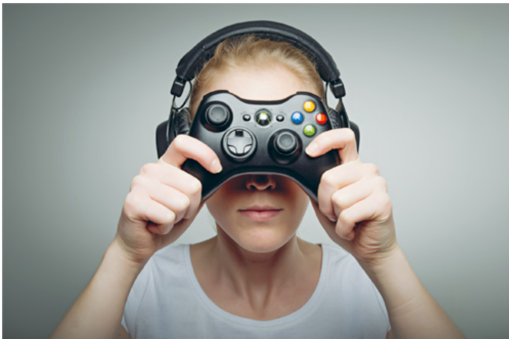
FLUKT: Nettspilling kan være en måte å fjerne seg fra ubehagelige følelser.

– Ja, det skal det. Men det er samtidig viktig å være nyansert og nøktern. Det som kan bekymre meg, er kombinasjonen tilgjengelighet og ensomhet. I den grad du er litt alene i verden og har behov for å isolere deg, er Internett et skummelt medium. Man kan skape en drømmeverden og ha et helt liv der. I kvasiforstand kan Internett dekke svært mange behov. Dette er også politisk interessant. Alkohol og spilleautomater regulerer man politisk fordi det er praktisk mulig og fornuftig. Norsk alkoholpolitikk har for eksempel vært gull verdt i et folkehelseperspektiv og har berget mange liv. Med Internett er det annerledes. Staten mister kontroll, Internett kan vanskelig reguleres. Det betyr at familien og foreldrerollen blir desto viktigere. Barneoppdragelse er først og fremst foreldrenes ansvar. Ikke skolens, ikke statens. Bruken av Internett på gutte- og jenterommene får fram dette poenget på en interessant måte. Den offentlige debatten har alt for lenge hatt som forutsetning at barnehage og skole er like sentrale oppdragere som foreldre. Det er rett og slett ikke tilfellet, mener Kjølstad.