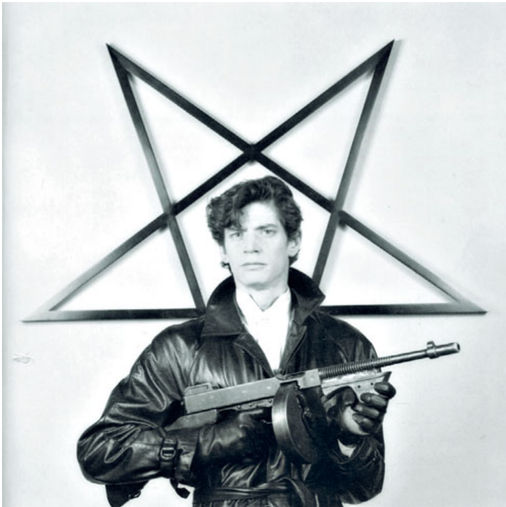
2. ROBERT MAPPLETHORPE: Selvportrett, 1983. Foto. Den katolsk oppdratte fotografen likte å fremstille seg selv som Djevelen, gitt hans «syndige» liv som homoseksuell. Her poserer han som djevlesk terrorist med automatvåpen foran en femtakket stjerne med spissen ned, Djevelens tegn.