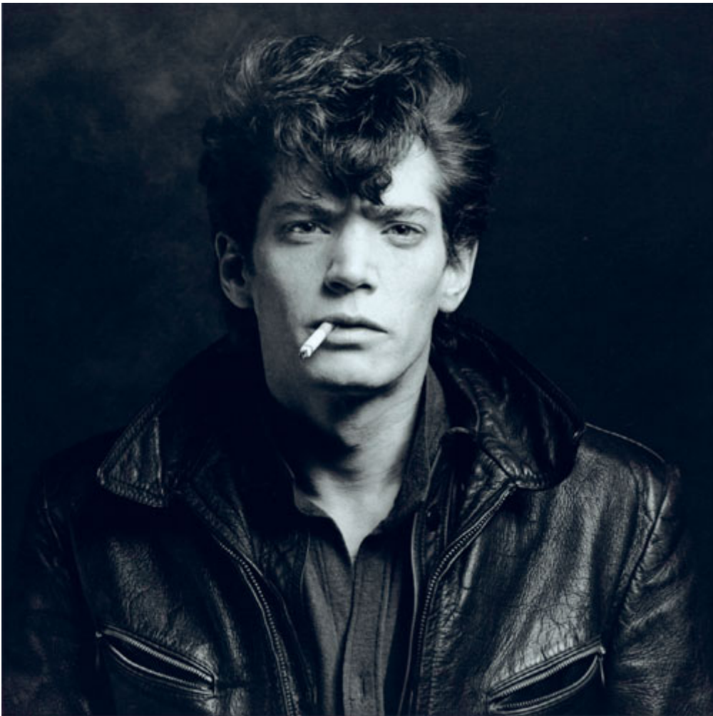
1. ROBERT MAPPLETHORPE: Selvportrett, 1980. Foto. Mange av selvportrettene er strenge, kontrollerte og rasjonelle iscenesettelser. Han likte å fremstille seg selv som cool og uanfektet av følelser.