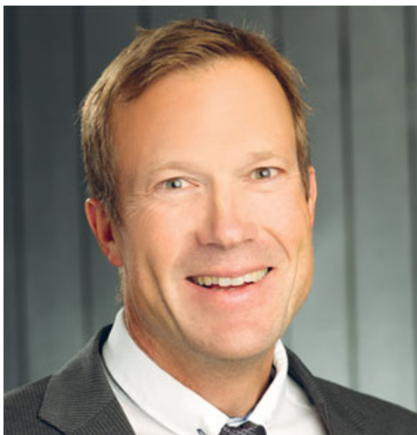
KONTROLL : Daglig leiar i

– Trass i mange år med forskning som viser den dårlege raliabiliteten og validiteten til psykiatriske diagnosar, held systemet fram. Folk trur at DSM-III rydda opp og at DSM-IV rydda opp, men det er framleis enorme problem med validitet, og betydelege problem med raliabilitet, knytt til mange diagnostiske kategoriar. Kvifor ignorerer folk dette? Tidsskrift med høg impact factor behandlar framleis desse kategoriane som om dei er sanne.