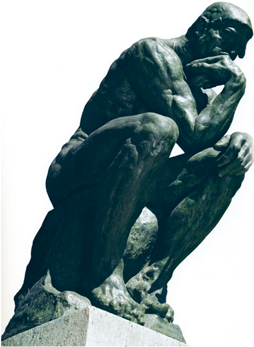
AUGUSTE RENOIR: Le Penseur (Tenkeren, 1879-1889)