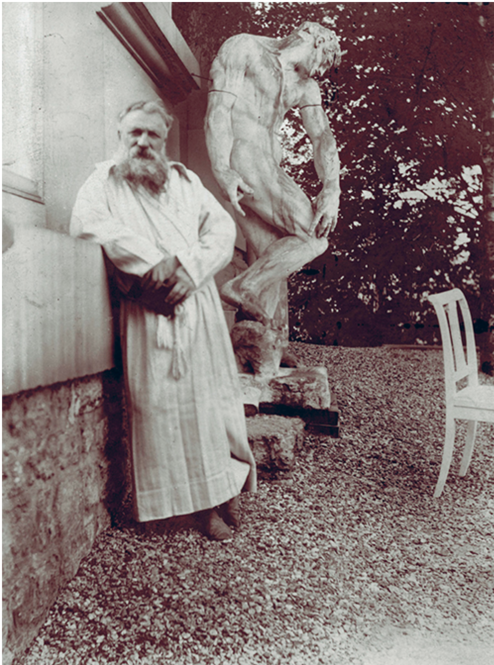
FRANCOIS AUGUSTE RENE RODIN: (1840–1917) i sin egen hage i Meudon, nær Paris, ca 1900.