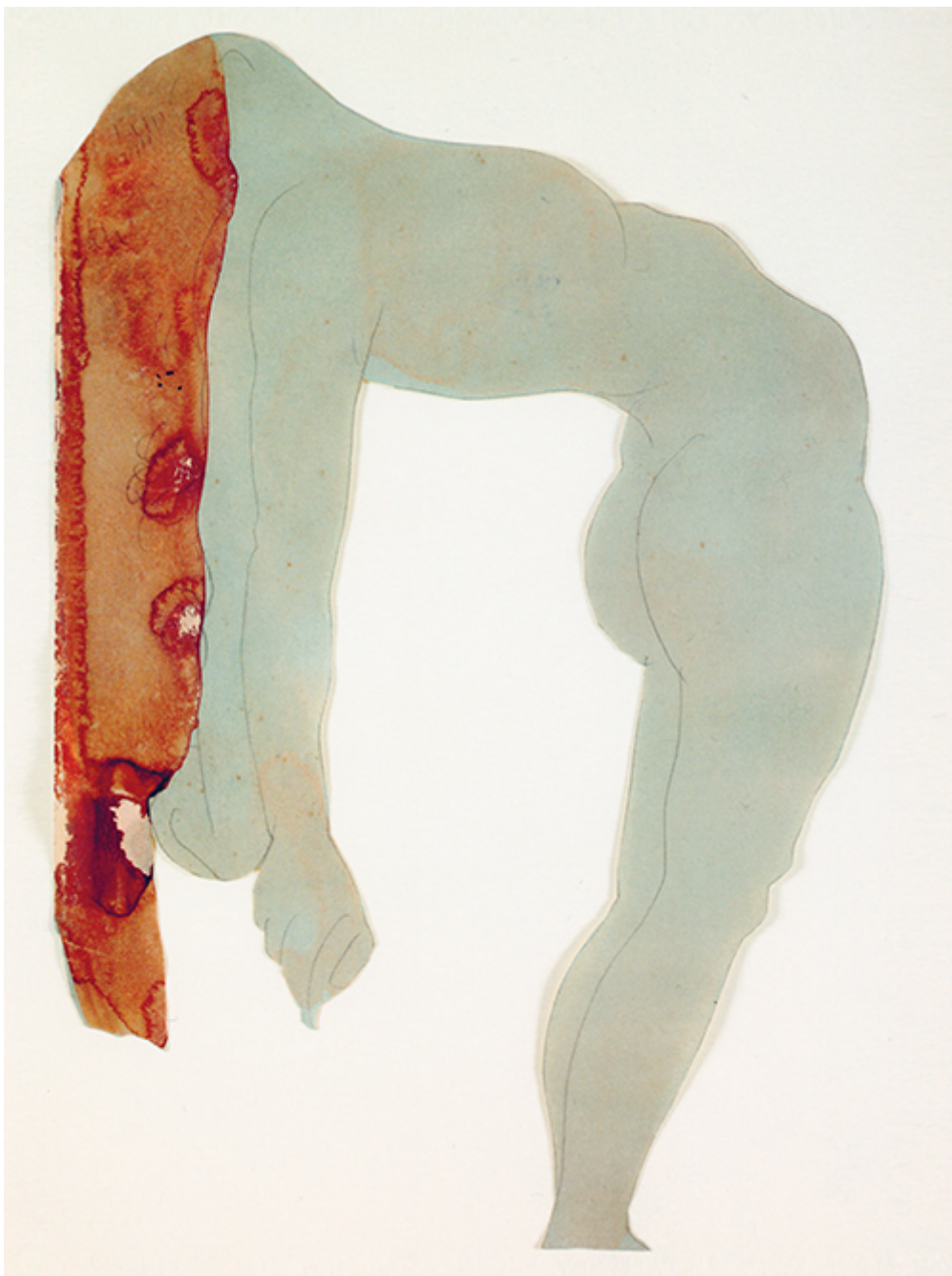
ILLUSTRASJON: AUGUSTE RODIN

Og dette er også selve kjernen i den vitenskapelige og kliniske tradisjonen omkring mentaliseringsbegrepet : Å integrere ny nevropsykologisk kunnskap med oppdatert empiri og teori om tilknytning for så å omsette dette til psykoterapeutiske prinsipper (Bateman & Fonagy, 2012).