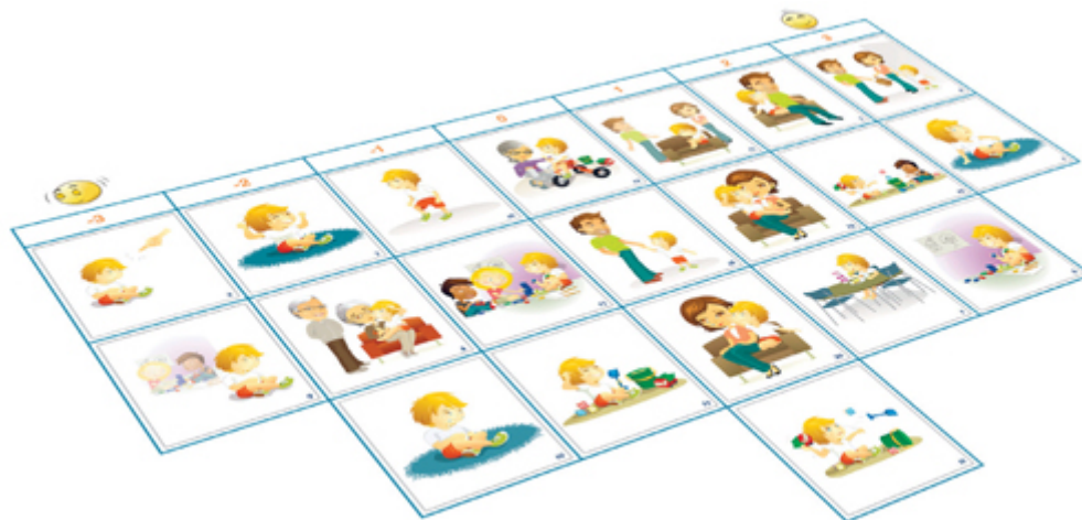
Figur 2. Visuelle kort og matrise brukt i studien med 5-åringar. Barna sorterte kort ut fra de syntes lignet på «hvordan de vanligvis hadde det» og hva som ikke lignet (Størksen et al., 2011). Her ser vi et konstruert eksempel på hvordan matrisen kunne ha sett ut etter sortering.