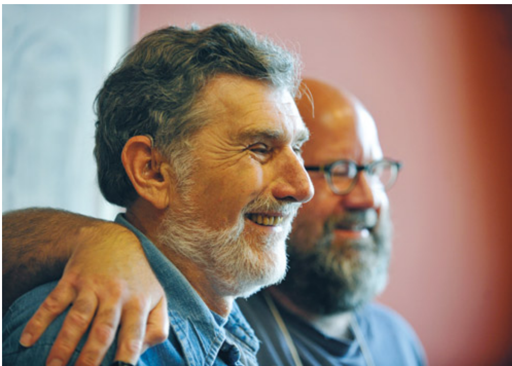
MØTTES I BUDAPEST: Elliott Aronsons (t.v.) udogmatiske innstilling og

Noen dager etter Beethoven-møtet innfinner vi oss i den staselige bygningen til vitenskapsakademiet på Roosevelt-plassen i hjertet av Budapest. Aronson forteller her levende fra sin selvbiografi som han er i ferd med å skrive. Han fokuserer særlig på sine lærere, motpolene og erkefiendene Abraham Maslow (1908–1970) og Leon Festinger (1919–1989), og hvordan han har forsøkt å ivareta arven fra dem begge.