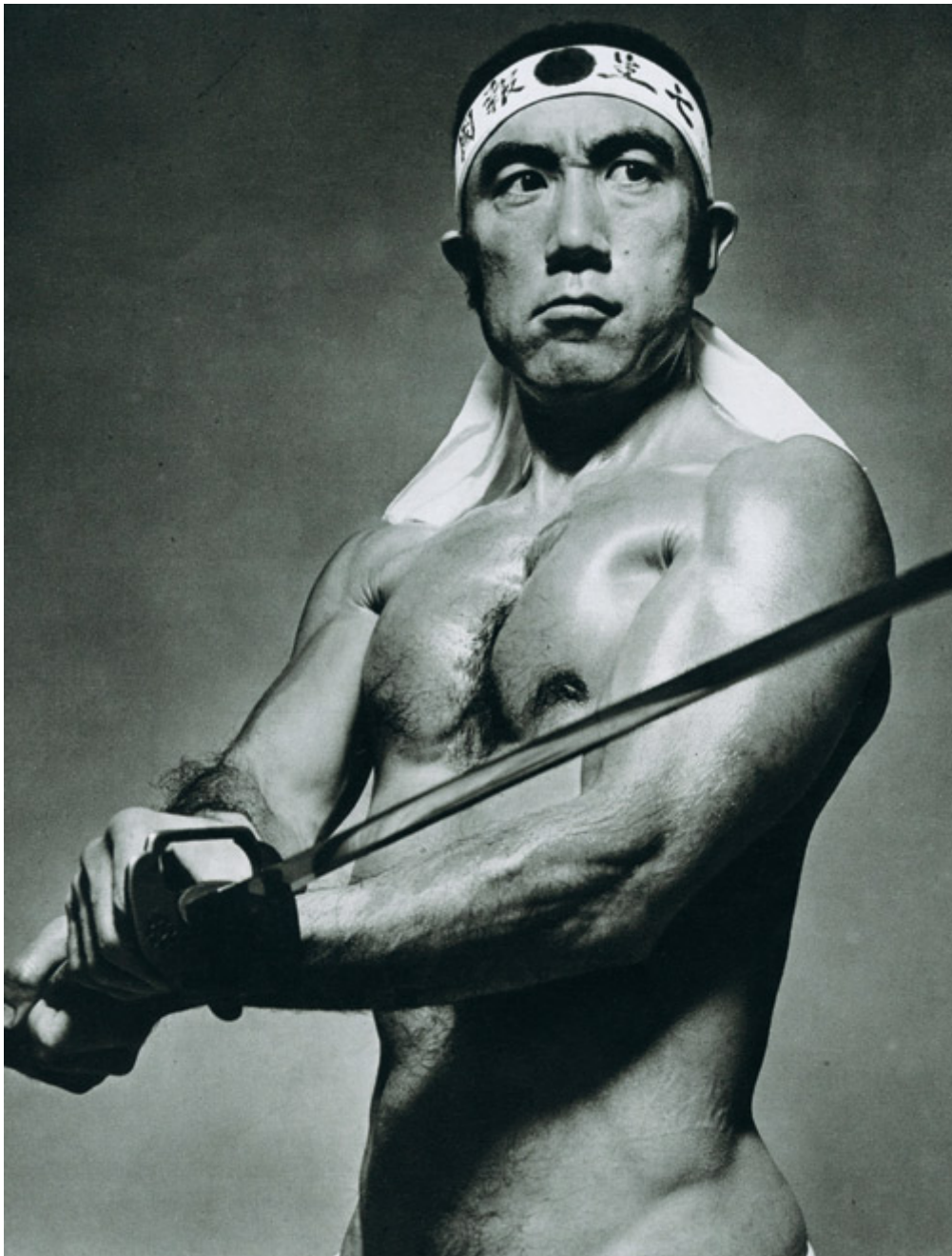
Yukio Mishima (1925-1970)

Later, much later, thanks to the sun and steel, I was to learn the language of the flesh, much as one might learn a foreign language.