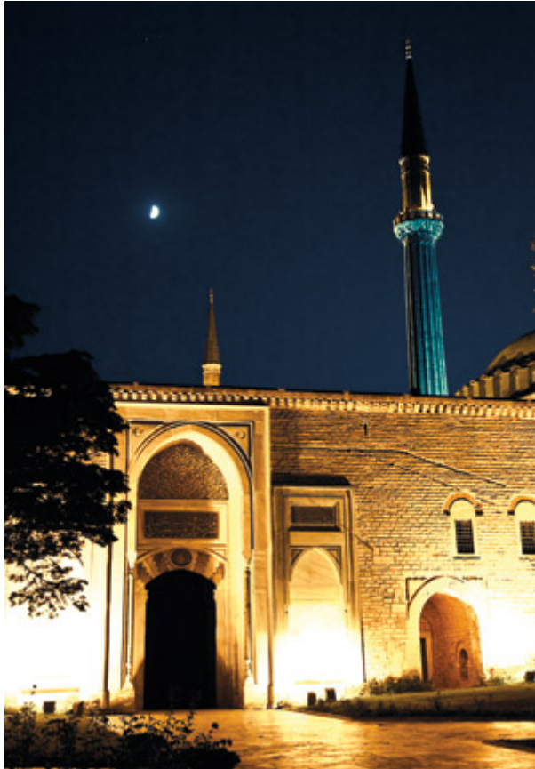
BAKTEPPE: Stemningsrapport frå Topkapi-palasset under gallamiddagen for kongressdeltakarane.