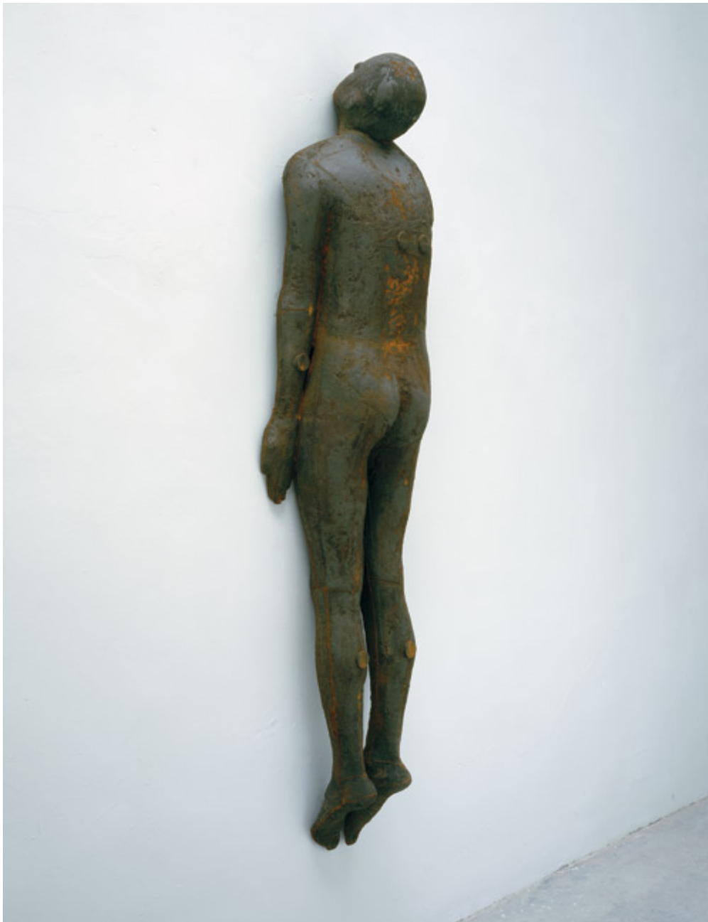
Shift II , 2000.

«Jeg setter dem på steder hvor du ikke venter å se dem, i veien, på en vegg, på stranden. Siden skulpturen ikke har en stemme, sender den spørsmål tilbake til spørderen. Hva gjør du? Hva mener du? Ved å plassere mine skulpturer for eksempel i Alpene, forsøker jeg å skape et reflekterende rom. Jeg vil at fjellvandrerne skal se på dem, ta på dem, vite at det er flere av dem, men at de ikke kan se dem; og slik trekkes inn i feltet av det som kan observeres og det som må fantaseres.