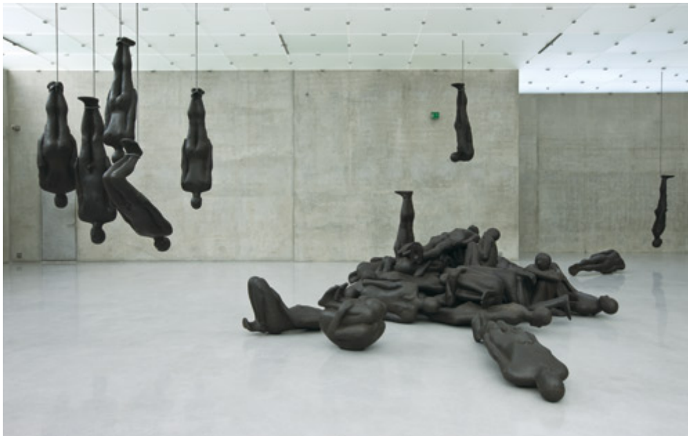
KRITISK: Critical Mass II (1995). En rekke skulpturer, liggende hulter til bulter omkring hverandre, og delvis oppå hverandre viser til grunnleggende posisjoner som å sitte, ligge og bøye seg.

Han ble del av en ung og urban kunstscene med radikale ambisjoner om å bryte over tvert og skape nytt. Han hentet mye inspirasjon fra aksjonskunstnere, som de såkalte Situationists i New York og Vienna Actionists . Rudolf Schwarzkogler var en forgrunnsfigur i wienergrenen, og var beryktet for blant annet bloddryppende selvskading på scenen. Men Gormley ønsket ikke å lage forestillinger, men stillestående objekter i rommet. Bed fra 1981 ble et vendepunkt for Gormley. Han fant sin syntese av aksjon og skulptur via en stor mengde brødskiver. Han laget en stor seng av 8 000 skiver hvitt brød. Og så spiste han brød svarende til sin egen kroppsmasse ganger to. Han laget to symmetriske avtrykk av seg selv i dobbeltsengen av brød. Det tok ham tre og en halv måneds spising. Slik oppdaget han sin egen kropp som kunstnerisk materiale og medium. Verket ble til gjennom munnen, magen og fordøyelsen.