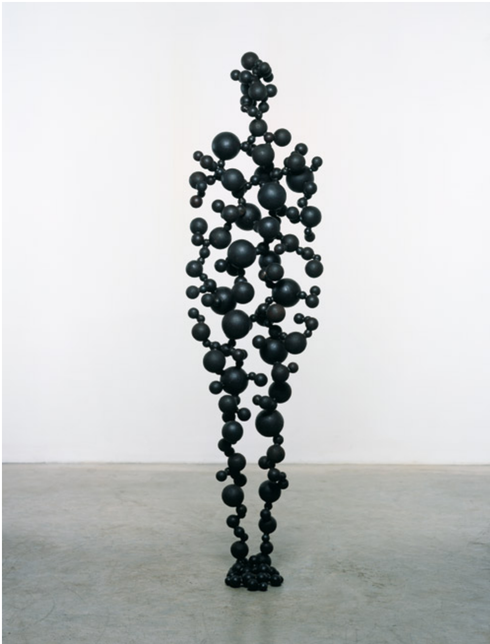
Standing Matter V , 2007.

Malerens syn er ikke lenger et blick på et ytre, en rent «fysisk-optisk» forbindelse til verden. Verden er ikke lenger fremfor ham som en forestilling: Det er snarere maleren som kommer til verden i tingene, som ved en konsentrasjon av det synlige, som gjennom det synliges til-syne-komst.