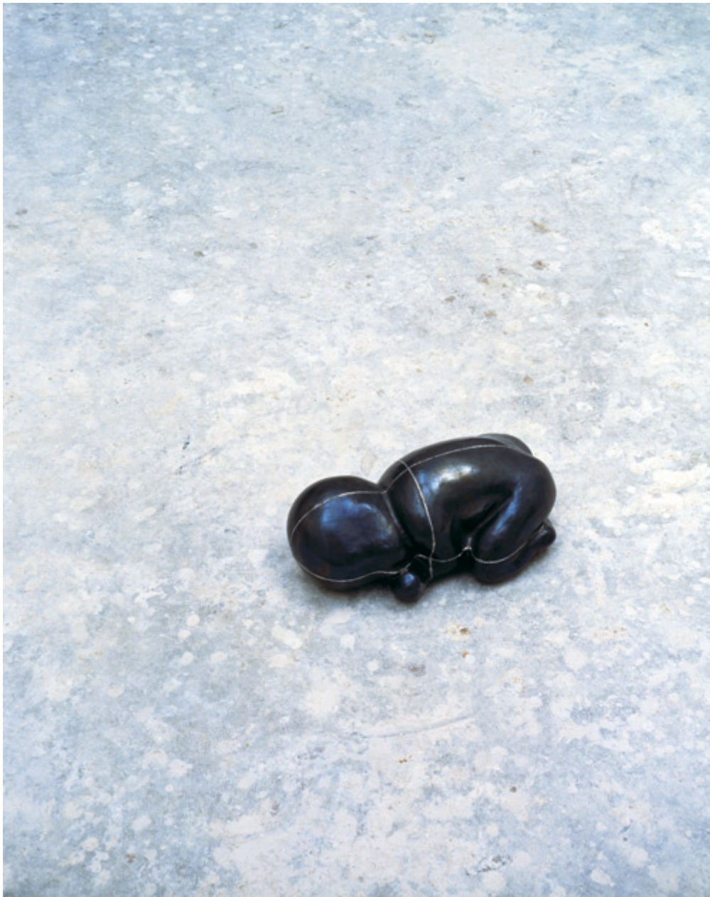
Still I , 1994

Descartes' grunnleggende vitenskapelige tilnærming var hans tvil. Den metodiske tvilen gikk ut på at han sanset seg selv og omverdenen, men kanskje var det bare noe han trodde. Fantest det i hele tatt noe han kunne være sikker på? Etter å ha tvilt konstaterte han at det var en ting han kunne være sikker på: at jeg tviler . Om dette har jeg en entydig og klar forestilling. Og vet jeg at jeg tviler, må jeg også kunne tenke. Med andre ord eksisterer jeg. Cogito ergo sum .