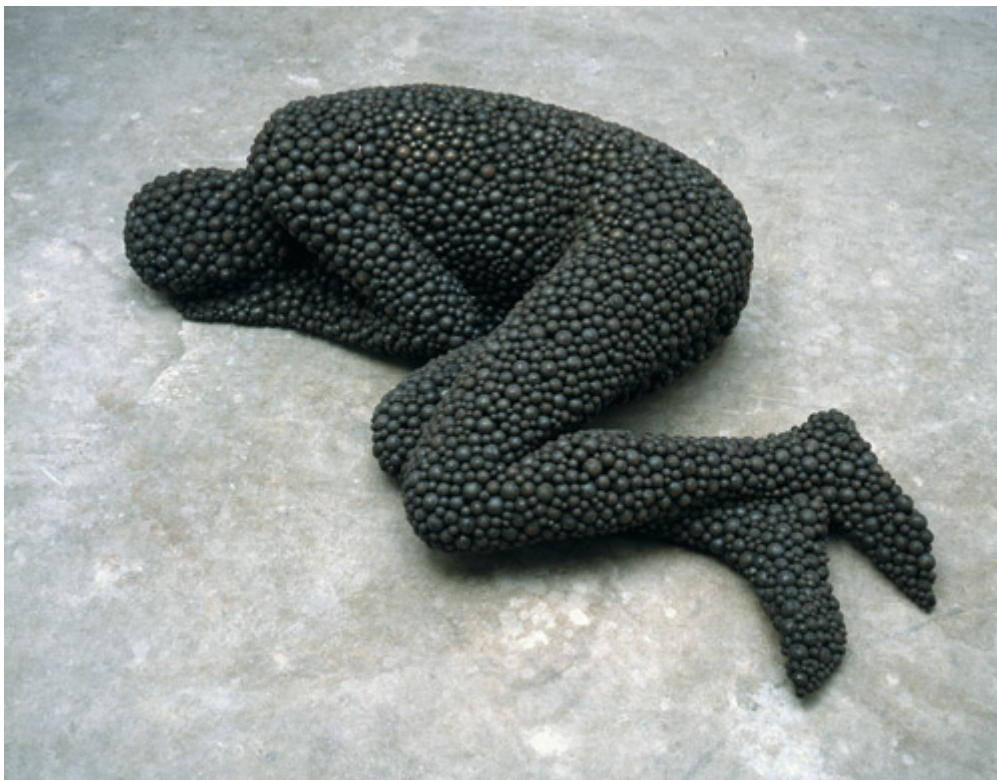
HVILE: Bodies at Rest I (2000).

The fact that we can never ever fully know the contents of another's mind or share her true feelings. This is what makes life worth living and art worth making!