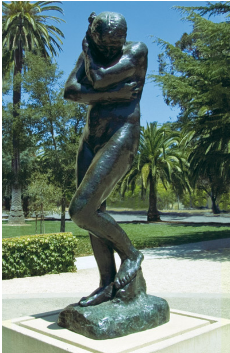
Blikkets sykdom. Skammen knytter seg til følelsen av å