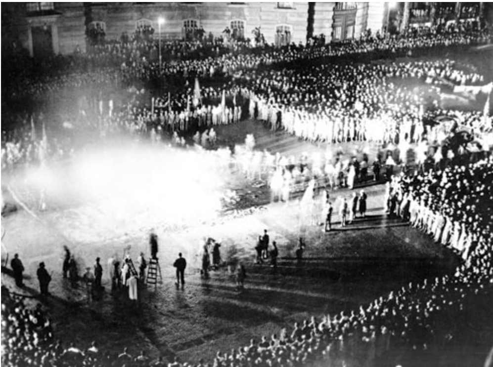
BOKBÅL: Nazistene brente bøker som brøt med deres ideologi. Her på Opernplatz i Berlin i mai 1933. Bøker av blant andre Erich Maria Remarque, Karl Marx og Sigmund Freud ble brent.

Freud tar kun milde smertestillende preparater, og må derfor utholde mye smerte. Han holder på med sitt siste originale verk Moses and Monotheism , og kan ikke fordre at bevisstheten påvirkes av analgetika. Etter hvert blir Freuds lengsel etter døden klarere i de tallrike brevene han skriver til venner og medarbeidere. I et brev til Stefan Zweig skriver han at han har hatt et usedvanlig rikt liv, men at han ikke kan forsones seg med «the wretchedness and helplessness of being old, and look forward to the transition into nonbeing with a kind of longing» (s. 112). I en hjerteskjærende beskrivelse i et brev til prinsesse Marie Bonaparte omtaler Freud sitt liv som «a small island of pain floating on an ocean of indifference» (s. 214).