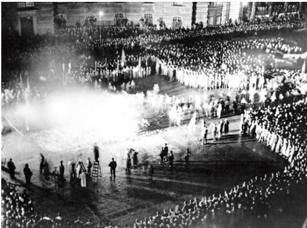
BOKBÅL: Nazistene brente bøker som brøt med deres ideologi. Her på Opernplatz i Berlin i mai 1933. Bøker av blant andre Erich Maria Remarque, Karl Marx og Sigmund Freud ble brent.

Freud tar kun milde smertestillende preparater, og må derfor utholde mye smerte. Han holder på med sitt siste originale verk Moses and Monotheism , og kan ikke fordre at bevisstheten påvirkes av analgetika. Etter hvert blir Freuds lengsel etter døden klarere i de tallrike brevene han skriver til venner og medarbeidere. I et brev til Stefan Zweig skriver han at han har hatt et usedvanlig rikt liv, men at han ikke kan forsones seg med «the wretchedness and helplessness of being old, and look forward to the transition into nonbeing with a kind of longing» (s. 112). I en hjerteskjærende beskrivelse i et brev til prinsesse Marie Bonaparte omtaler Freud sitt liv som «a small island of pain floating on an ocean of indifference» (s. 214).