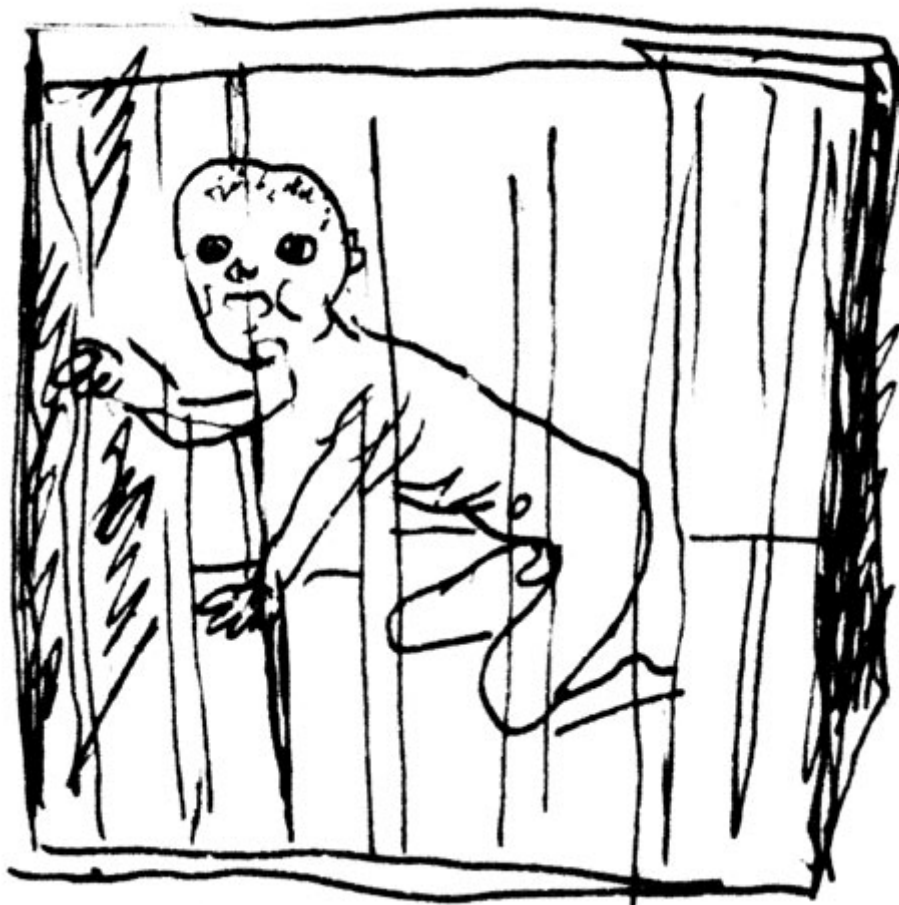
Et barn i bur: Etter morens død kunne Ekelöf endelig snakke fritt og ble ytterligere forløst som poet.