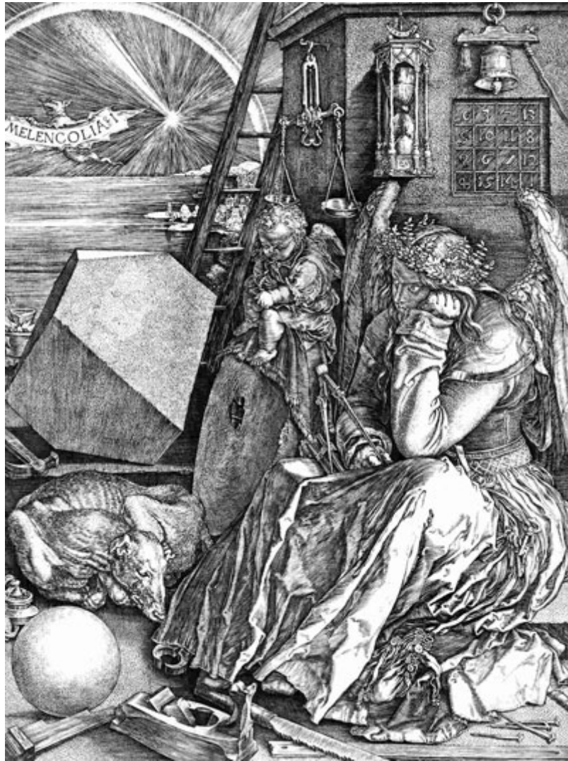
MELENCOLIA I: Dürers bilde hang på vegg i Ekelöfs mange hjem. Særlig festet han seg med klystérsprøyten nederst til høyre, et symbol for at melankolikerens stillesittende grubling gir forstoppelse.

Kan vi, i et psykologisk perspektiv, forstå opphavet til den dype skammen? Én forståelse er knyttet til krenkelsen og til traumet. Skammen følger i kjølvannet av den andres atferd. Skammeren kan være den ytre andre, eller sosiale institusjoner. Det kan dreie seg om ydmykkelser, mobbing, aggresjon, rasisme, maktmisbruk, fysiske eller seksuelle overgrep. Den dype skamfølelsens paradoks er at det ofte er feil folk som skammer seg. Det seksuelle overgrepet mot barnet er et ureksempel på hvordan overgriperens skamløse atferd kan påføre offeret dyp og livsvarig skam.