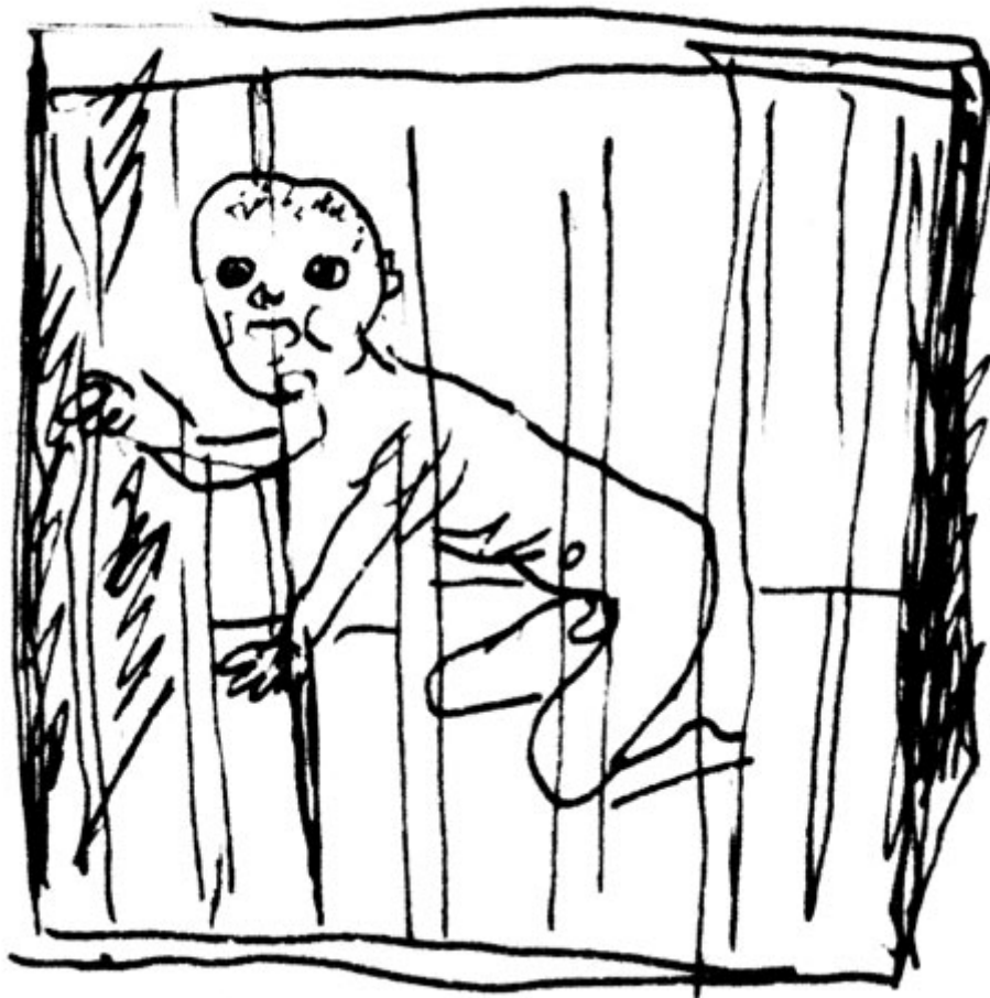
Et barn i bur: Etter morens død kunne Ekelöf endelig snakke fritt og ble ytterligere forløst som poet.