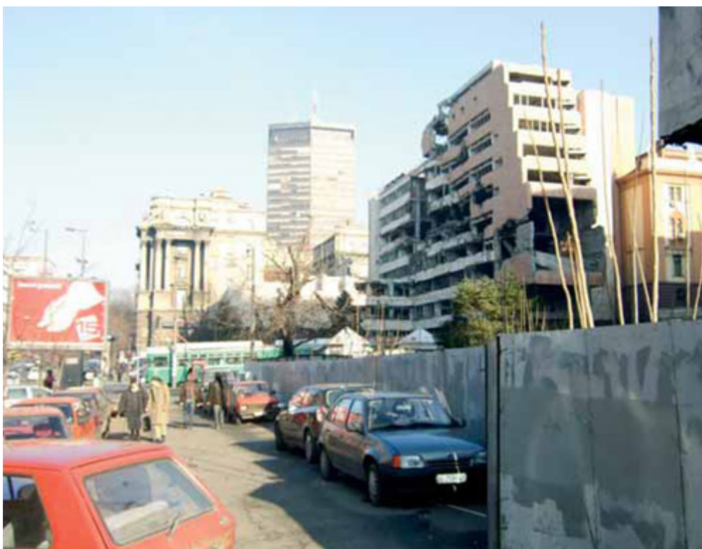
HOVEDSTADEN: Beograd, ennå med tydelige spor av NATOs bombing av den serbiske hovedstaden i 1999.

I Serbia er det store økonomiske, regionale og etniske forskjeller. Romabarn som vokser opp i romaleire (sigøynerleire), er de mest ekskluderte og marginaliserte. Mer enn 80 % av disse barna er fattige, og praktisk talt alle indikatorer peker på multidimensjonell diskriminering og ekstrem deprivasjon. Spedbarnsdødeligheten er tre ganger høyere enn gjennomsnittet i Serbia, og bare 10 % blir vaksinerte. Disse barna lider av sykdom og kortvokstheth som et resultat av neglekt og underernæring. De vokser opp i forurensete omgivelser og har svært begrenset adgang til helse og utdanning.