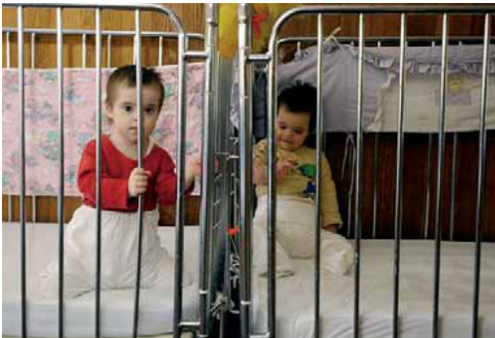
VEGG I VEGG: To små skjebner på en serbisk institusjon for foreldreløse barn.

Jugoslavia var under Tito et forholdsvis moderne og vestlig orientert land, sammenliknet med andre land i østblokken, og hadde en viktig rolle som en slags brobygger mellom øst og vest i Europa. Folk var stolte over denne rollen, og de kunne reise hvor de ville i verden. Den kommunistiske modellen sørget for at alle hadde adgang til helse og utdanning. På enkelte områder kan Serbia fremdeles virkelig imponere; for eksempel er det vedtatt at hver skole skal ha sin egen psykolog. Slå den!