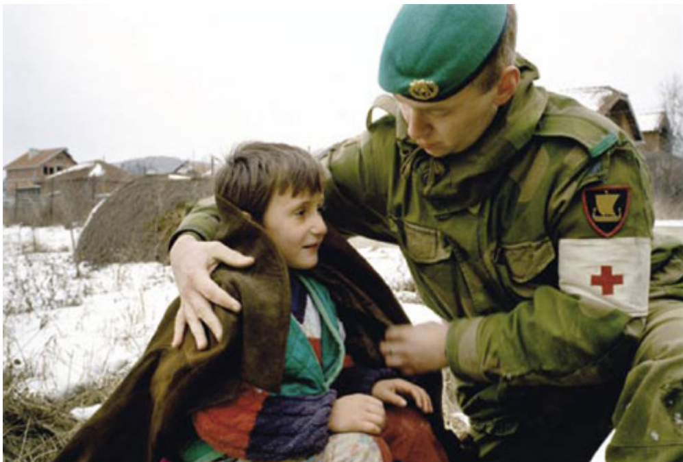
En soldat fra Telemarkbataljonen hjelper en liten kosovoalbansk gutt å holde varmen.