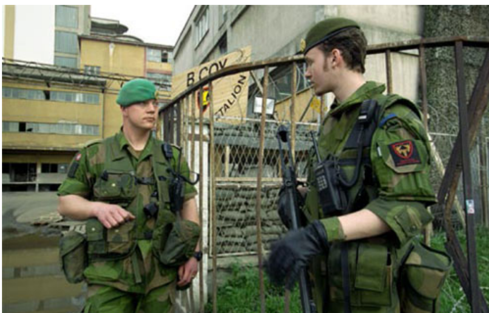
En erfaren og en ny mann under opplæring står vakt i porten ved mølla nær Kosovo Polje, mars 2000.

Artikkelen bygger på Horveraks (2001) hovedoppgave i psykologi. Takk til befal og mannskaper i Norbn II, militærpsykologigruppen ved Sjøkrigsskolen og til Forsvarsdepartementet for finansiell støtte til undersøkelsen.