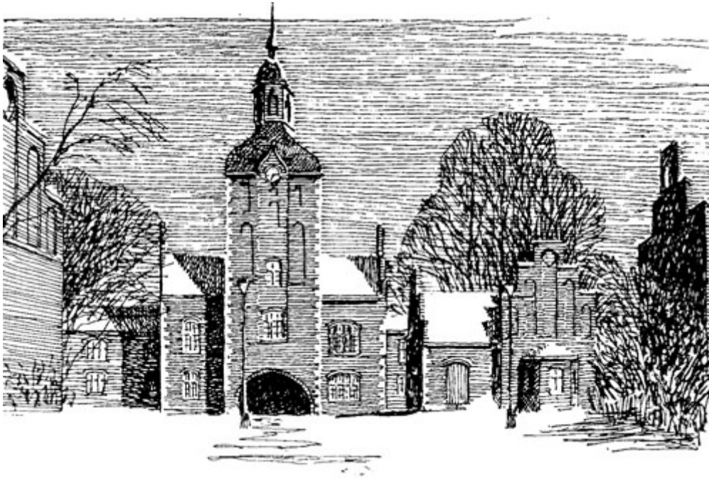
Administrasjonsbygget. Tegning av Odd Brochmann.

På hver side av tårnbygget ligger «Fruentimmer»- og «Mandfolk»-avdelingene i symmetriske paviljonger. Midt i mellom kvinne- og mansavdelingene finner vi kontor- og verkstedbygg, vaskeri og fyrhus. I den opprinnelige planen var det fire fløyer på hver side, med en femte avdeling knyttet til den bakerste fløyen, men D- og E-fløyen ble sløffet under byggeprosessen.