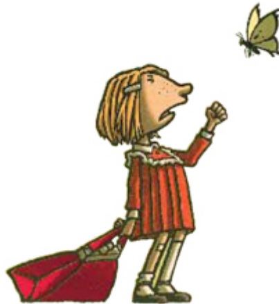
Ill.: Peter Schössow. Fra boka Skal det være sånn??!

Trym bor sammen med Trollpappa og de andre trollene i Trollfjellet. En dag blir Trollpappa dødssyk. Før han dør, gir han Trym en gave. Gaven er forbudt i Trollfjellet, og må holdes skjult. Men den blir oppdaget, og Trym tvinges på flukt, på en reise i følelsenes landskap.