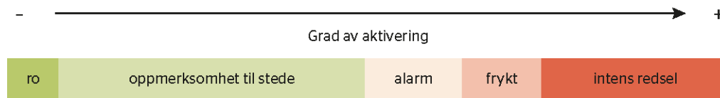
Figur 2 Grad av aktivering av stressresponsssystemet

Konseptet om tilstandsavhengig fungering (Perry & Szalavitz, 2017) kan ses på som en nyansering, presisering og konkretisering av toleransevindumodellen (Nordanger & Braarud, 2014; Ogden et al., 2006). Ifølge den nevrosekvensielle modellen kan vår fungering basert på grad av aktivering av stressresponsssystemet deles inn i fem ulike tilstander langs et kontinuum (se figur 2).