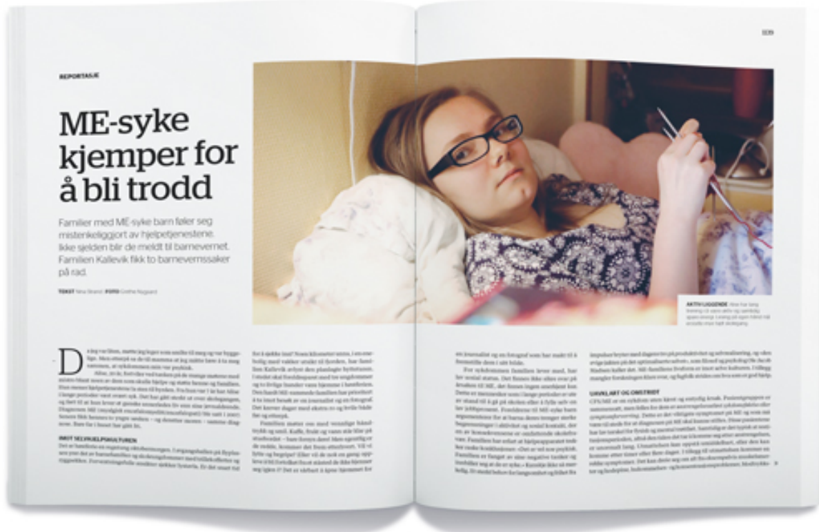
SKAPTE DEBATT Psykologtidsskriftets reportasje fra desember 2017 om en familie med ME-syke sparket i gang en debatt om sykdommen. Både brukere og fagfolk engasjerte seg i diskusjonen (se boks).

– Jeg føler jeg står mellom to motpoler i debatten, i hvert fall slik den kan fremstå i offentligheten. På den ene siden er de som ikke har forstått ME, og mener at «du må tenke annerledes». Den motsatte siden mener at ME ikke har noe med psyken å gjøre. Selv tenker jeg at stress kan være en av flere faktorer som bidrar. Da mener jeg ikke først og fremst det åpenbare stresset, men et mer automatisert stress, et «alarmsystem» i nervesystemet som er i ubalanse, og som ikke er så lett å kontrollere. Her mener jeg det er viktig å ha en utforskende holdning heller enn å snakke om skyld.