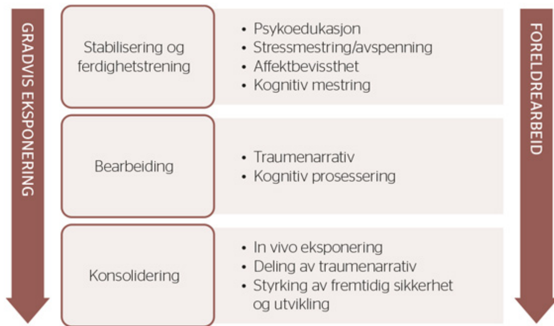
FIGUR 2. Komponentene i TF-CBT

kan deles inn i tre faser. Først en fase med stabilisering og ferdighetstrening , bestående av de fire komponentene psykoedukasjon, avspenning/stressmestring, affektregulering og kognitiv mestring. Deretter følger en bearbeidingsfase med de to komponentene traumenarrativ og kognitiv prosessering. Til slutt gjennomføres en avsluttende konsolideringsfase med de tre komponentene in vivo eksponering (ved behov), deling av traumenarrativ og styrking av fremtidig sikkerhet og utvikling. Foreldrearbeidet foregår parallelt gjennom hele behandlingsforløpet (se figur 2), og ofte vil også samarbeid med skole og nettverk skje parallelt.