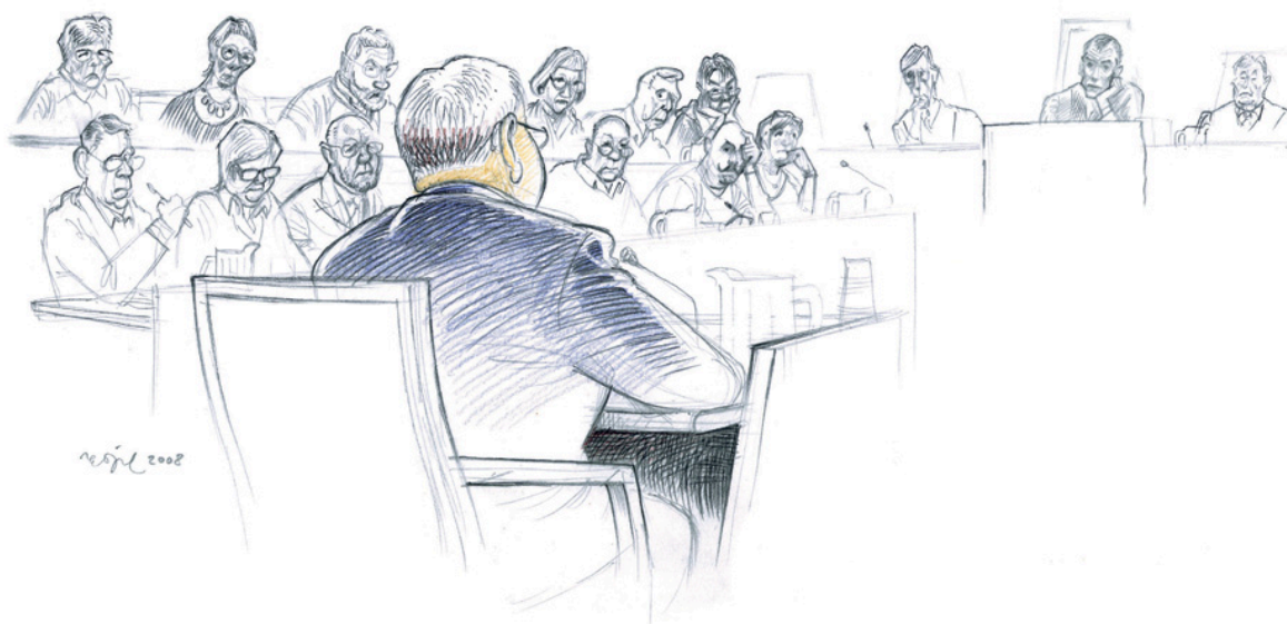
PRESTEN I RETTEN Presten (55) i Glåmdalen forklarer seg for Eidsivating lagmannsrett 25. februar 2008. Tegning: Egil Nyhus