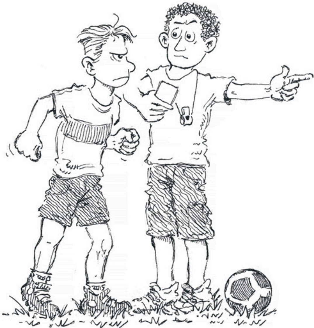
Illustrasjon fra bokserien «Psykologi for barn»

Mine barns vei inn i bøkens verden kan illustrere at det å hente kunnskap fra litteraturen ikke er noe små barn trenger å lære – det faller dem naturlig, det er en uunnværlig del av deres litterære liv. Og behovet for å trekke linjer fra litteraturen til den fysiske virkeligheten oppstår altså samtidig som og sammen med det vi kanskje kan kalle ufiltrert litteraturglede – fryden over rytmer og rim, behovet for å få vite hvordan det går , øyeblikkets nytelse.