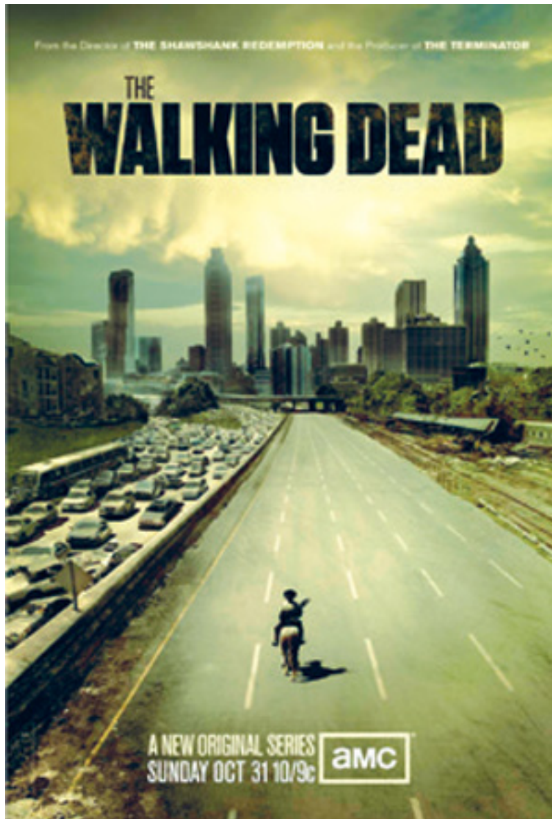
Frank Darabont The Walking Dead – sesong 1 AMC, 2010

TV-serien er løselig basert på Robert Kirkmans omfattende tegneserieepos med samme navn. Den har kommet ut siden 2003, og det er ingenting som tyder på at den noen gang kommer til å avsluttes. Kirkman har sagt at hans prosjekt er å «utforske hvordan mennesker reagerer på ekstreme situasjoner, og hvordan disse hendelsene forandrer dem». Han tilføyer at det er en bonus hvis folk blir skremt, men at det ikke er det viktigste. The Walking Dead finnes dessuten som dataspill og i bokform, med andre ord representerer historien en sjangerblanding som synes å ha fått sin egen dynamikk. Igjen er likheten med Sult slående.