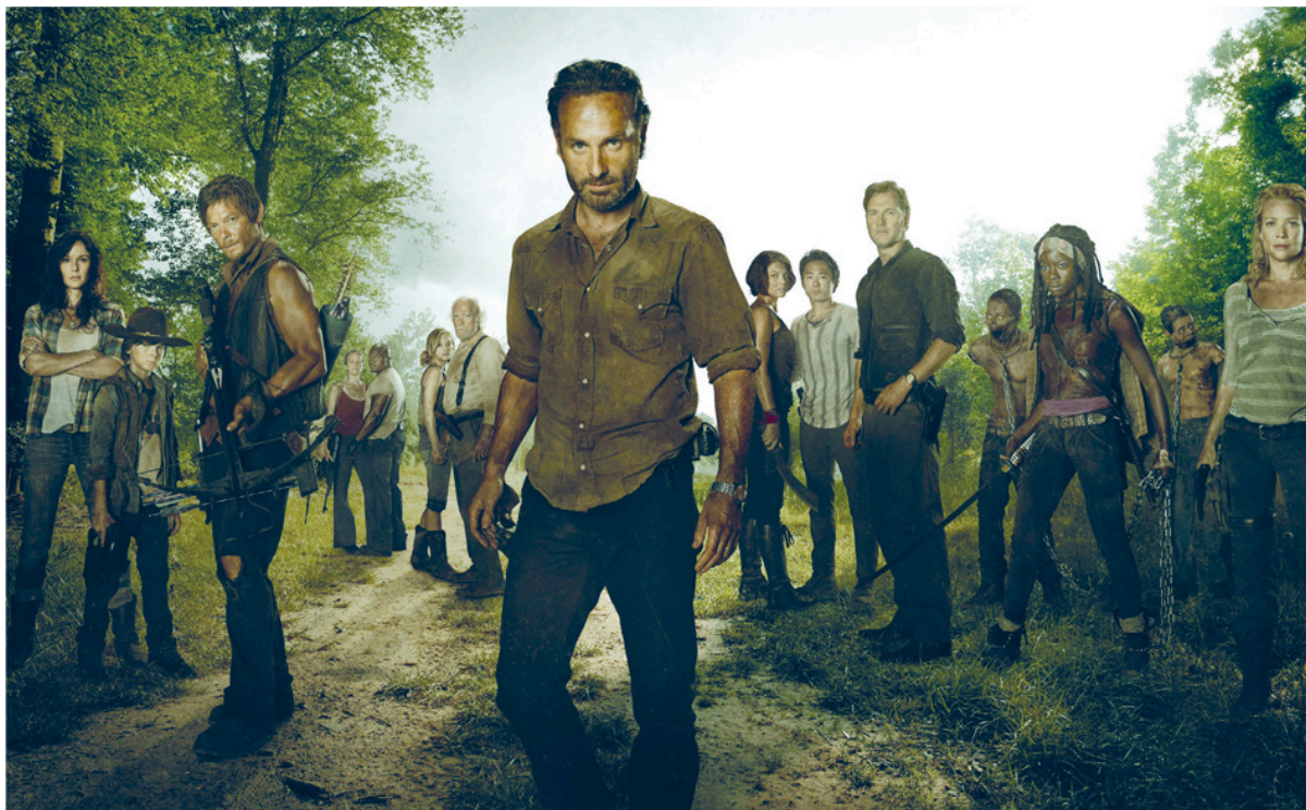
Andrew Lincoln (fremst i bildet) spiller hovedpersonen Rick i serien The Walking Dead.

Det er flere likhetstrekk enn man skulle tro mellom Hamsuns modernistiske roman, Sult , og tv-serien The Walking Dead , produsert 120 år senere.