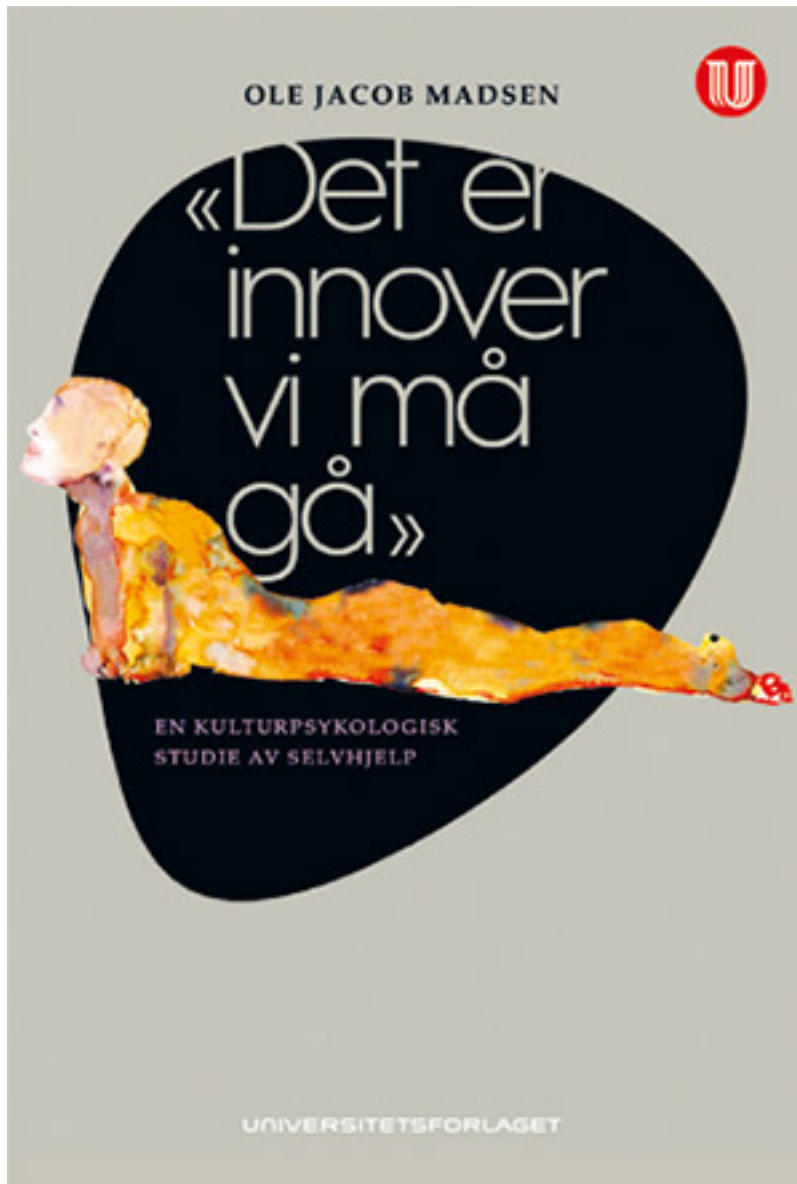
Ole Jacob Madsen «Det er innover vi må gå» En kulturpsykologisk studie av selvhjelp Universitetsforlaget 2014

Hvis dette er noenlunde riktig, forstår man kanskje hvorfor selvhjelpslitteraturen selger så godt som den gjør. For når folk vender seg bort fra den ytre verden og går innover, trenger de noen som kan fortelle dem hvordan de skal håndtere det elendige og forfengelige de finner der inne. Og det er jo nettopp dette selvhjelpsbøkene tilbyr: De er håndbøker i selvspleie, som tar mål av seg til å fortelle leseren hvordan hun kan bli sunnere, roligere, smartere, mer selvsikker, mer produktiv, gladere og mer glad i seg selv – og, ikke minst: lykkeligere .