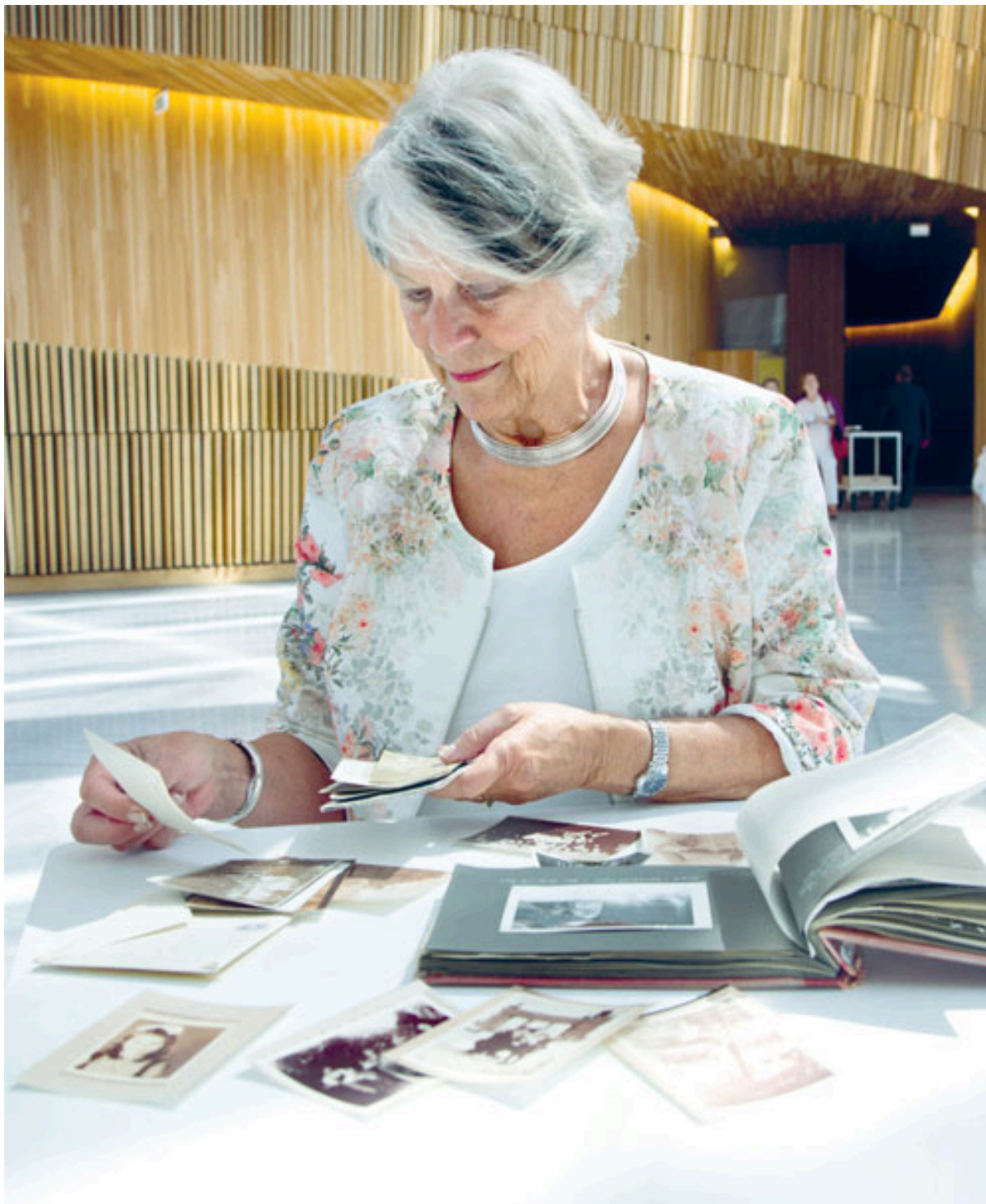
FOTOGRAFIENES FORTELLINGER: Bugge med familiefotografier som vitner om nærhet og bånd, men også tap og brudd.

– Han møtte meg med klare forventninger. «Det er viktig for meg å kunne diskutere vanskelige spørsmål med deg og at du kan gi meg faglige råd. Det kan hende at jeg vil legge store byrder på dine skuldre. Er du villig til å ha en slik rolle?», sa han til meg.