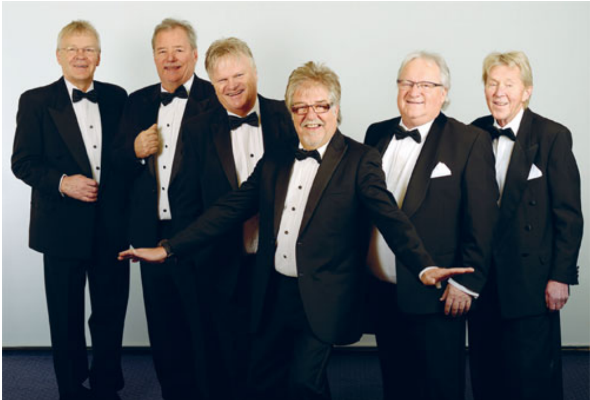
MUSIKALSK SELVHJELP? Ole Ivars – et av Norges ledende danseband.

Hva er likheten mellom selvhjelpsbøker og Ole Ivars? Ingen av dem passer spesielt godt til gåselever og champagne.