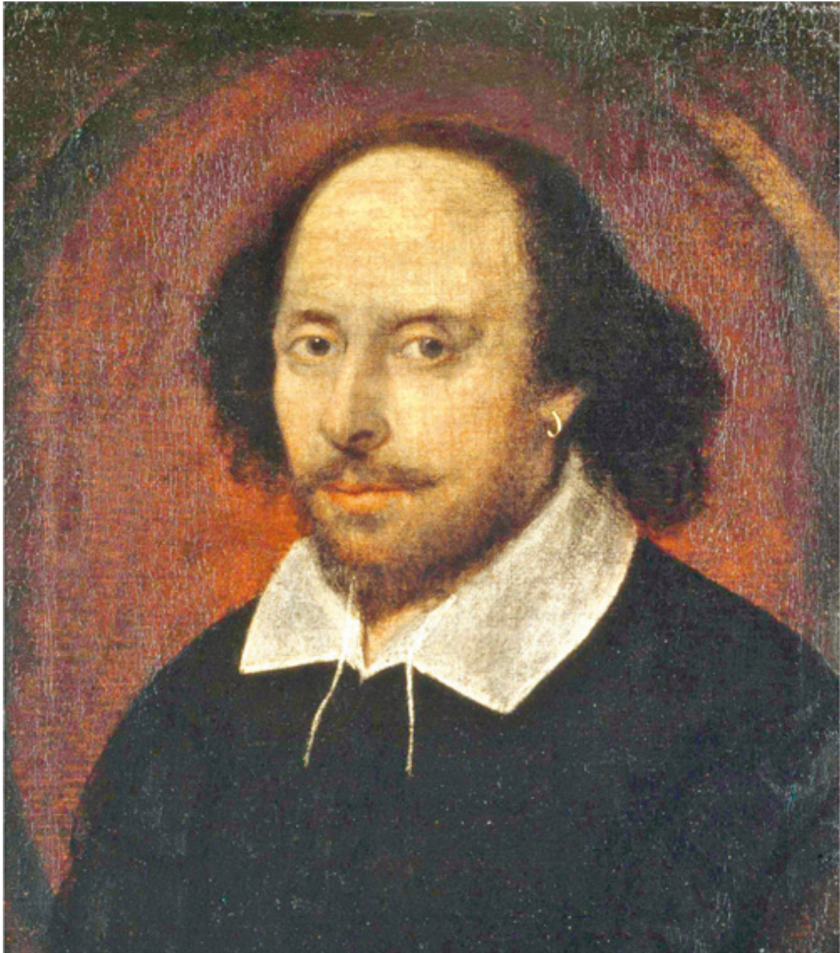
MOTREAKSJON: William Shakespeare (1564–1616) åpner opp diskursen om selvmord igjen.

– Det er derfor essensielt at journalister setter seg grundig inn i Vær Varsomplakaten og WHO's retningslinjer for omtale av selvmord før de skriver en eneste linje om det.