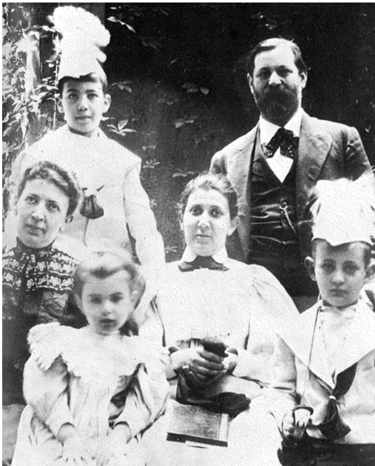
STORFAMILIE: Sommeren 1896 flyttet Minna Bernays inn hos sin søster Martha, Sigmund Freud og deres barn. Bildet viser (fra venstre til høyre) Martha Freud, Martin Freud, Anna Freud, Minna Bernays, Sigmund Freud og Ernst Freud. Bildet er tatt ca 1898 i Berggasse 19, en moderne bygård i Wien hvor familien bodde.

Freuds forhold til sin svigerinne var på mange vis mer fortrolig enn det han hadde til sin kone. Og når de to skrev seg inn som dr. Sigmund Freud og frue, må det være lov til å lure på hvordan det sto til i denne familien.