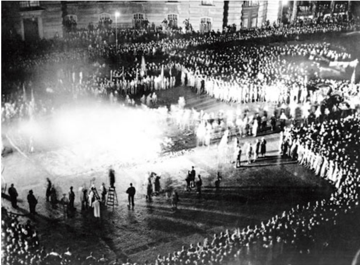
BOKBÅL: Nazistene brente bøker som brøt med deres ideologi. Her på Opernplatz i Berlin i mai 1933. Bøker av blant andre Erich Maria Remarque, Karl Marx og Sigmund Freud ble brent.

Freud tar kun milde smertestillende preparater, og må derfor utholde mye smerte. Han holder på med sitt siste originale verk Moses and Monotheism , og kan ikke fordra at bevisstheten påvirkes av analgetika. Etter hvert blir Freuds lengsel etter døden klarere i de tallrike brevene han skriver til venner og medarbeidere. I et brev til Stefan Zweig skriver han at han har hatt et usedvanlig rikt liv, men at han ikke kan forsone seg med «the wretchedness and helplessness of being old, and look forward to the transition into nonbeing with a kind of longing» (s. 112). I en hjerteskjærende beskrivelse i et brev til prinsesse Marie Bonaparte omtaler Freud sitt liv som «a small island of pain floating on an ocean of indifference» (s. 214).