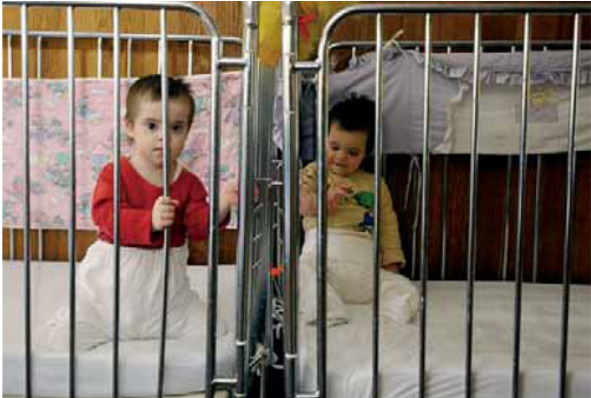
VEGG I VEGG: To små skjebner på en serbisk institusjon for foreldreløse barn.

Jugoslavia var under Tito et forholdsvis moderne og vestlig orientert land, sammenliknet med andre land i østblokken, og hadde en viktig rolle som en slags brobygger mellom øst og vest i Europa. Folk var stolte over denne rollen, og de kunne reise hvor de ville i verden. Den kommunistiske modellen sørget for at alle hadde adgang til helse og utdanning. På enkelte områder kan Serbia fremdeles virkelig imponere; for eksempel er det vedtatt at hver skole skal ha sin egen psykolog. Slå den!