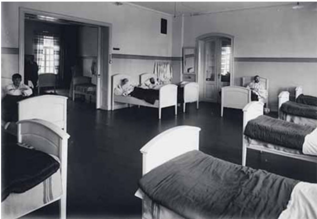
LITE PRIVATLIV: Sovesal for menn, Dikemark sykehus 1905.

han et årlig tillegg på 450 kroner. Begynnerlønn for en pleierske uten sykepleierutdanning var 2070 kroner, og det var ikke tillegg om hun var gift. Beløpene omfattet kost og losji, som var satt til 720 kroner og som ble fratrukket lønnen. Fra sykehusets åpning var arbeidstiden for sykepleiepersonalet 75 timer per uke, iberegnet forskjellige ekstravakter som man ikke fikk betalt for» (s. 126). Likeledes i forhold til hygiene og kontrolltiltak: «På Gaustad asyl ble undertøyet til pasientene skiftet en gang per uke og laken en gang per måned ... På de urolige avdelingene fikk man ikke spise med gaffel og kniv, men måtte bruke fingrene på grunn av angsten for selvskading. Selvmord var da også sjelden i asylet. Da man fikk et selvmord i 1891, var det 15 år siden man sist hadde hatt noe selvmord. I 1907 [i Trondhjems hospitalstiftelses sinnssykeasyl] er det kommet duker på spisebordene, og blikkopper er avløst av steintøy. De syke som søler, får smekker på ved bordet. I det hele ble det lagt mer vekt på den personlige hygiene, noe som har medført en økning av vaskeutgiftene. Tidligere skiftet de syke undertøy og strømper hver 14. dag, og det var fire om et håndkle i uken. Som ved de hellige kilder i Lourdes var det så sparsom tilgang på varmt vann at opptil seks pasienter måtte bade etter hverandre i det samme vannet» (s.127/s. 132).