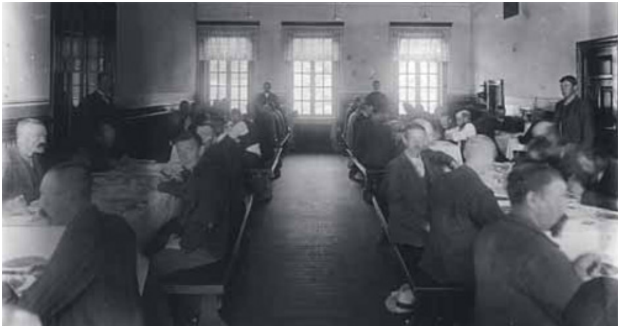
MANNSSAMFUNN: Spisesal for menn, Dikemark sykehus 1905.

samfunn og illustrerer ofte med statistikk som gir et informativt bilde av situasjonen. Han lykkes godt med sine intensjoner med boken. Med sin massive erfaring fra psykiatrien evner Kringlen også å illustrere fremtredende etiske dilemmaer på en måte som yter deres kompleksitet rettferdighet. For eksempel er det viktig å merke seg at mange etiske dilemmaer i psykisk helsevern teoretisk viser en likhet med spill av «non-zerosum»-typen, hvor en må tolerere en type kostnad for å oppnå en annen type gevinst, men hvor to bestemte typer positive utfall ikke vil være mulig samtidig. Et slikt eksempel kan være at vi både ønsker færre selvmord i psykiatrien og samtidig en åpnere, mindre kontrollerende og intimitetsovertråkkende psykiatri. Dette er neppe mulig. Tiltak som reduserer selvmord, vil i mange tilfeller bestå av kontrolltiltak og reduksjon av individets tilgang til potensielle selvmordsmetoder. Slike tiltak vil nødvendigvis måtte oppleves som intimitetsovertråkkende. Dette dilemmaet illustreres av situasjonen på Psykiatrisk klinikk på Vinderen: «Det var et strengt autoritært regime, og alvorlig deprimerte pasienter ble ofte på klinikken til de var «friske». Man opplevde da også sjelden selvmord. Helt frem til 1962, altså i en periode på nesten 40 år, hadde man bare hatt to selvmord i klinikken» (s. 173).