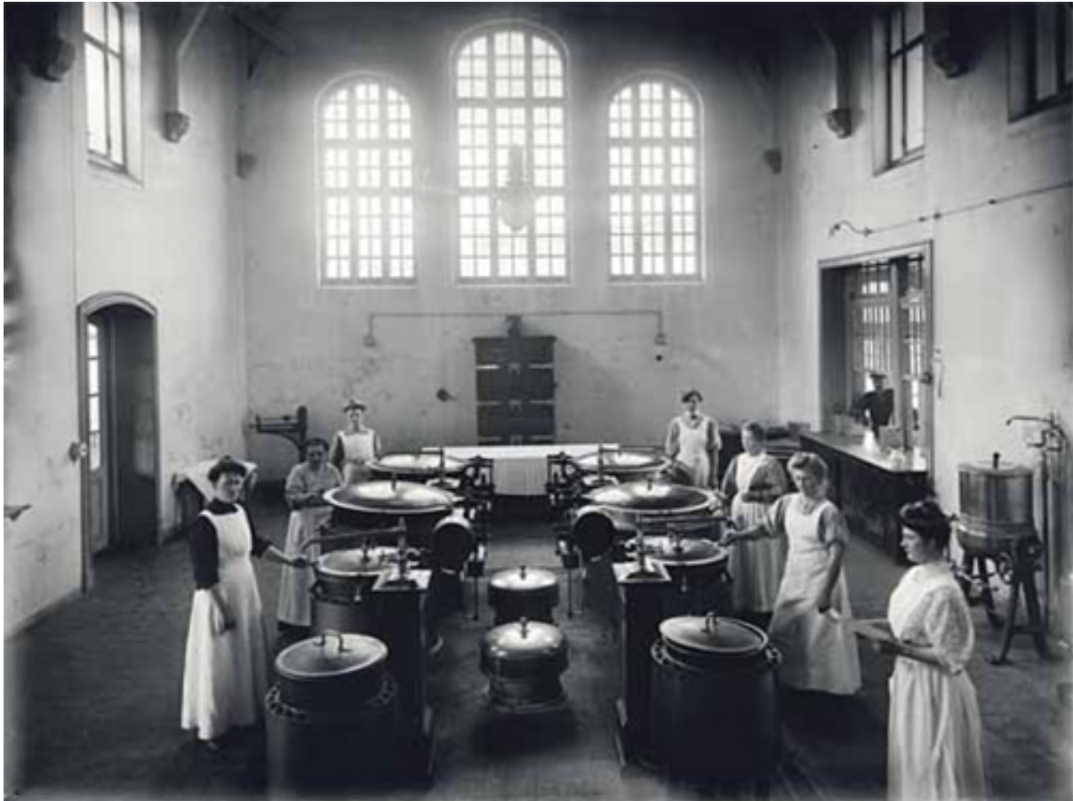
STORE FORHOLD: Kvinner koker mat i sentralkjøkkenet, Dikemark sykehus 1905.