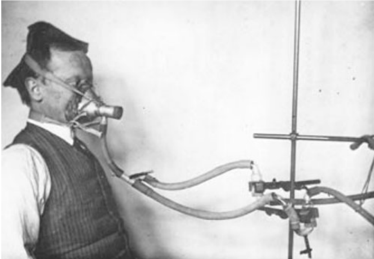
Mand med respirasjonsmaske fra forsøg med stofsifteundersøgelse ved sjælelig virksomhed.